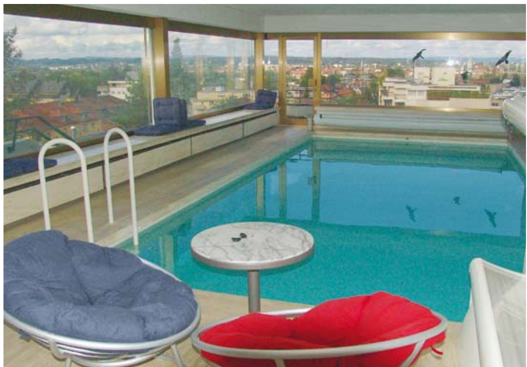
Lichtdurchflutetes Badevergnügen über den Dächern Kreuzlingens

Durch ein korrosionsfreies Technaflon Nasskamin werden die kalten Abgase über Dach geführt. Dabei werden im Winter täglich bis zu 200 Liter Kondensat, das sonst als saurer Regen unsere Umwelt schädigt, aus Wärmetauscher und Kamin abgeführt, neutralisiert und zu dem häuslichen Abwasser gegeben.