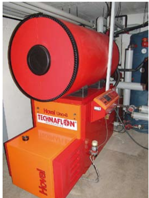
Zwei TechnaPlus-Wärmetauscher hinter dem neuen Ölkessel